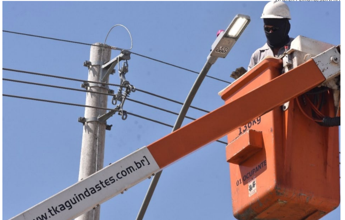
Equipes da Seinfra começam trabalho de efficientização da iluminação que empresa fará a partir de agora

Antes da homologação da licitação, a própria Seinfra começou o trabalho de efficienti-