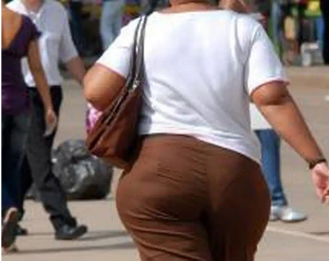
Existe ainda um grande estigma em torno de o que é obesidade e seu impacto na saúde

A obesidade é multifatorial, mas por muitos anos houve uma compreensão “errada” de que era um problema relacionado à falta de vontade das pessoas ou compulsão alimentar