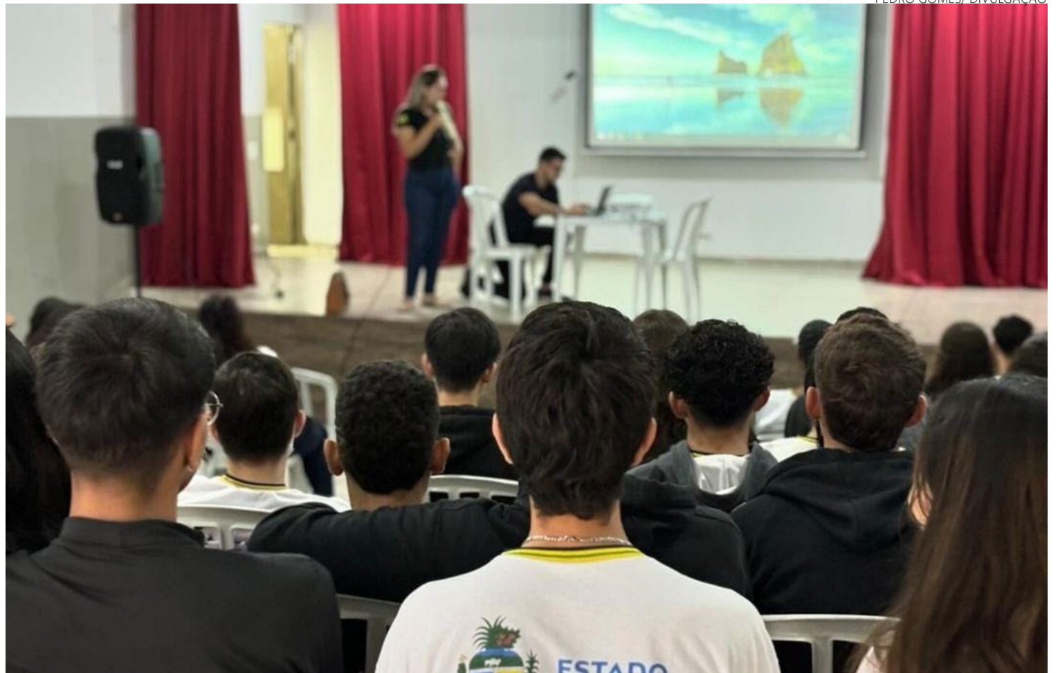
Alunos do Centro de Ensino em Período Integral Professor Pedro Gomes, no Setor Campinas, redefinem o que é ensino

Os projetos desenvolvidos no CEPI são exemplos de sucesso educacional. O Projeto Jovens Escritores não só desenvolve habilidades literárias, mas também promove a expressão pessoal e a pluralidade de vozes entre eles, resultando em