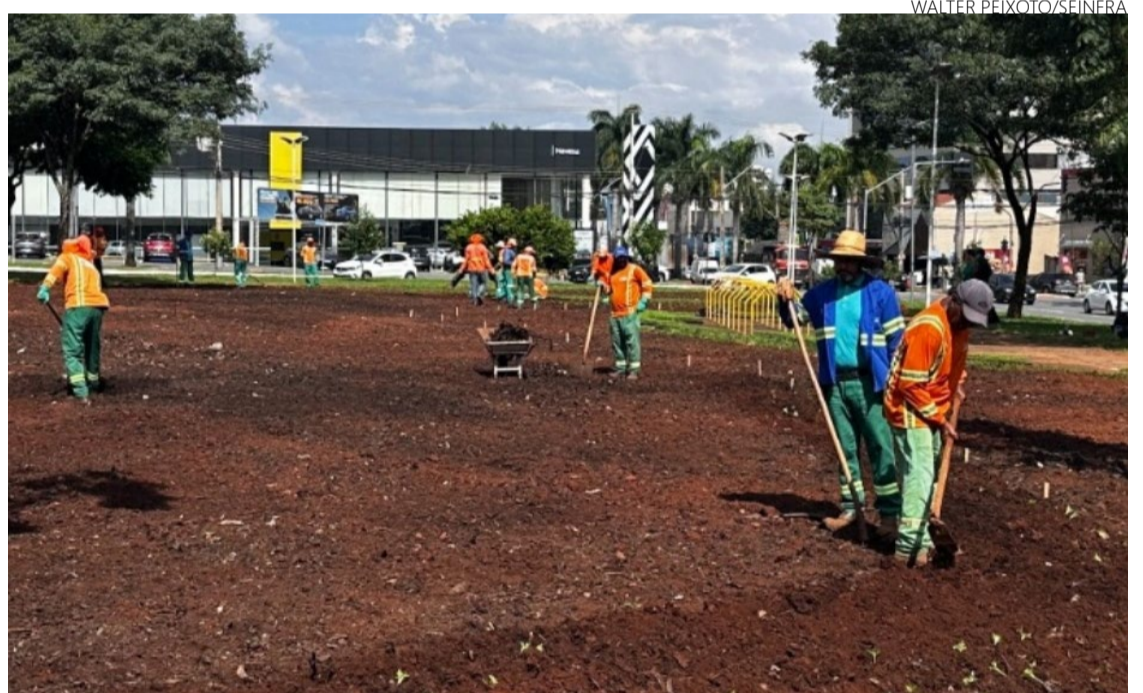
Praça Nova Suíça terá plantio de mudas floríferas nesta semana

A programação desta semana contempla as praças Irani Andrade, Piricota, Universitária e Léo Lynce; os trevos do Jardim Guanabara, saída para Trindade e saída para Inhumas, Avenida Portugal com a Mutirão e Avenida T-02 com T-08.