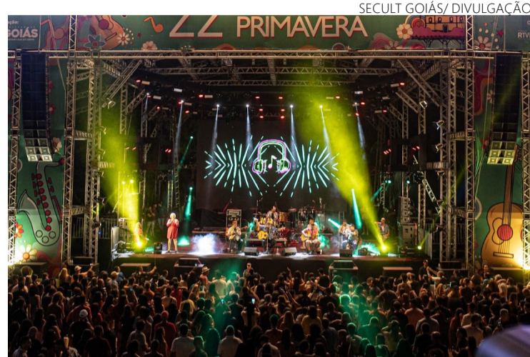
Calendário: evento agitará Pirenópolis entre 3 e 8 de setembro

Canto da Primavera seleciona 55 apresentações musicais. Inscrições serão feitas pelo site oficial