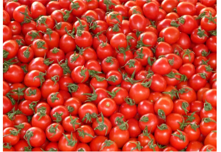
Produção de tomate no Estado deve crescer 36,6% nesta safra 2024

A 38ª edição da Festa do Tomate de Goianápolis acontece de hoje a 28 de julho, no Parque de Exposição Agropecuária da cidade