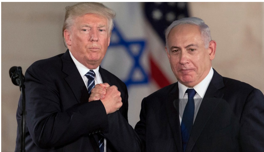
Reunião ocorre em um contexto de relações tensas entre os dois líderes, exacerbadas por eventos recentes e desacordos passados

Trump e Netanyahu em Mar-a-Lago é significativo do ponto de vista político e diplomático. Ele pode marcar uma virada