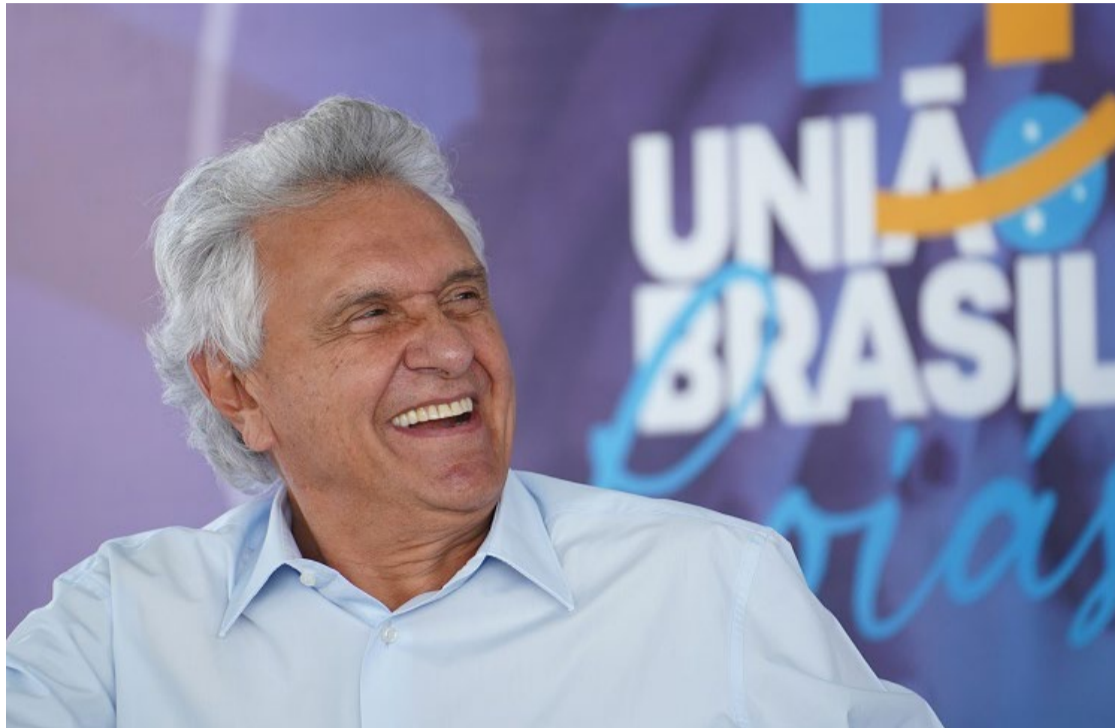
Ronaldo Caiado: forte influência junto aos eleitores de Goiânia em 2024

Considerando a margem de erro da pesquisa, que é de 4% para mais ou para menos, a primeira rodada Serpes/O Popular em Goiânia mantém os números alcançados pelo governo Caiado em outro levantamento divulgado em meados de junho próximo passado e realizado pelo instituto Goiás Pesquisas/Mais Goiás. Naquele estudo, o governo Caiado recebeu avaliação positiva de 79,54% dos goianienses, que se dividiu em excelente (12,79%), ótima (19,37%) e boa (47,38%). Os percentuais de entrevistados que o consideram ruim (2,8%) e péssimo (3,17%) somaram 5,97%. Não soube responder 0,61%. O instituto Serpes ouviu 601 eleitores, entre os dias 14 e 15 de julho. A margem de erro é de 4 pontos percentuais para