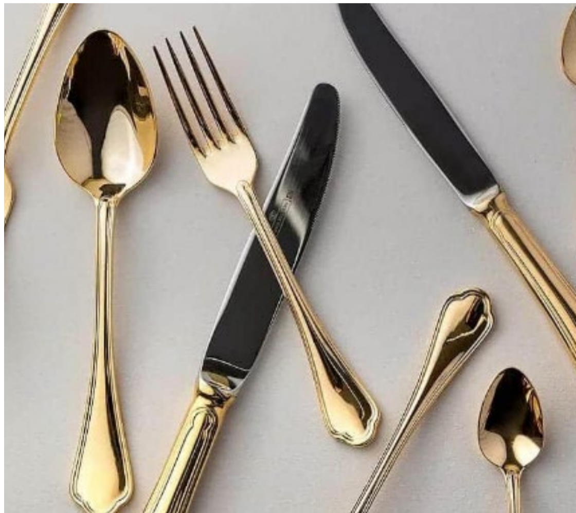
País europeu é conhecido por suas regras rigorosas à mesa

A França teve um papel significativo na popularização do uso dos talheres na Europa e no mundo ocidental. A França é conhecida por suas regras rigorosas de etiqueta à mesa, que incluem o uso dos talheres. As normas francesas de etiqueta foram amplamente adotadas pelas cortes e a alta sociedade europeia.